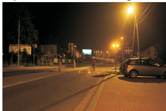
Bielsko-Biała, ul. Żywiecka